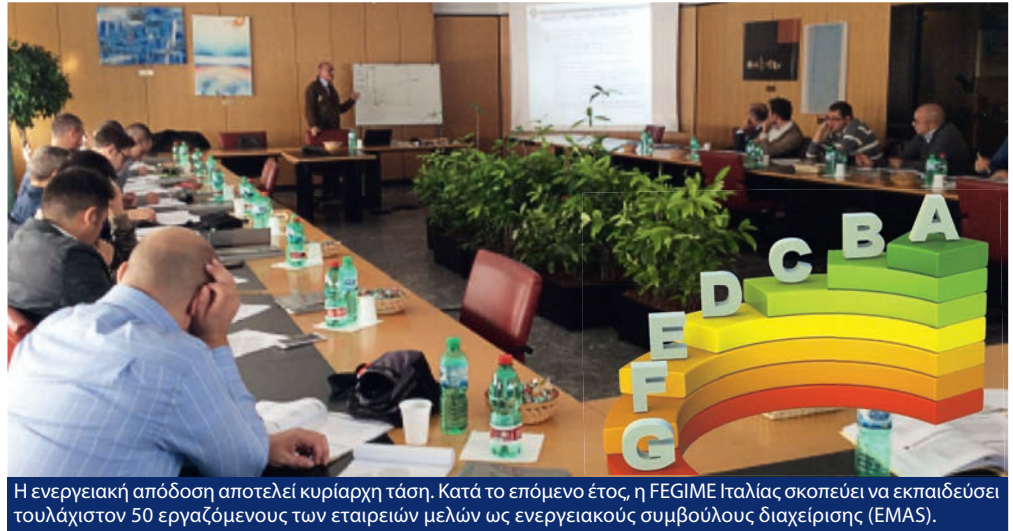
Η ενεργειακή απόδοση αποτελεί κυρίαρχη τάση. Κατά το επόμενο έτος, η FEGIME Ιταλίας σκοπεύει να εκπαιδεύσει τουλάχιστον 50 εργαζόμενους των εταιρειών μελών ως ενεργειακούς συμβούλους διαχείρισης (EMAS).

Ένα μεγάλο πρόγραμμα αφιερωμένο στη μεγαλύτερη ενεργειακή αποδοτικότητα και στις πιο αποτελεσματικές διαδικασίες. Η FEGIME Ιταλίας έχει φιλόδοξους στόχους.