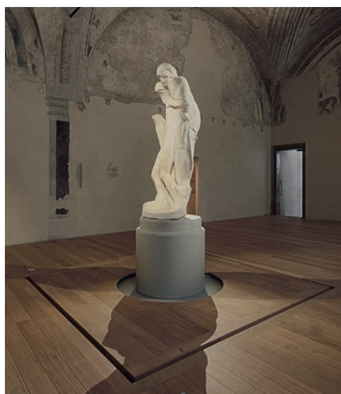
Museo della Pietà, Μιλάνο: Οι μονάδες χωνευτής τοποθέτησης UDHOME της OBO και τα συστήματα συγκάλωσης καλωδίων OKB παρέχουν μια πολύ διακριτική και ευέλικτη παροχή ρεύματος γύρω από το τελευταίο αριστούργημα του Μιχαήλ Αγγέλου.

Μέχρι σήμερα, τα συστήματα αυτά έχουν παραμείνει κρυμμένα ενδοδαπέδια - ή υπόγεια. Και αυτός είναι ο λόγος που η OBO οραματίστηκε την ιστορία των ενδοδαπέδιων συστημάτων υπό τη μορφή ενός υπόγειου χάρτη (μετρώ). Κρυμμένα κάτω από την επιφάνεια, τα υπόγεια και ενδοδαπέδια συστήματα συνδέουν διαφορετικούς «σταθμούς». Κατά τους προσεχείς μήνες, η OBO θα εστιάσει στις δραστηριότητες μάρκετινγκ τους για την ενδοδαπέδια επέτειο.