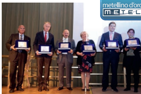
Οι Ιταλοί πρωτοπόροι σε θέματα ηλεκτρονικής ανταλλαγής δεδομένων: τα μέλη της FEGIME Ιταλίας στην τελετή απονομής των βραβείων «metellino d'oro».

Οι πρώτες αξιολογήσεις δείχνουν ότι με τη χρήση της ηλεκτρονικής ανταλλαγής δεδομένων, η αποτελεσματικότητα και η ποιότητα των υπηρεσιών των εταιρειών χονδρικής πώλησης - μελών βελτιώνεται σημαντικά. Η πραγματοποίηση παραγγελιών, η έκδοση τιμολογίων κ.λπ. χωρίς χαρτί, αποτελεί ένα μεγάλο βήμα προς τα εμπρός. Αλλά δεν σταματά εκεί: σήμερα υπάρχουν πρόσθετα πλεονεκτήματα που παρέχονται από το νέο σύστημα που βασίζεται σε σύννεφο το «CloudEDI» γεγονός που καθιστά την ασφαλή μεταφορά των δεδομένων ακόμα πιο εύκολη και παρέχει στους Ιταλούς συναδέλφους μας με περαιτέρω ευκαιρίες για τη βελτίωση της παραγωγικότητας.